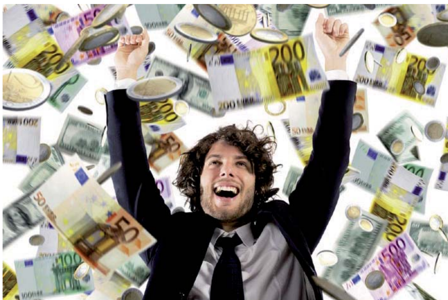
Profitieren Sie von unseren Steuertipps