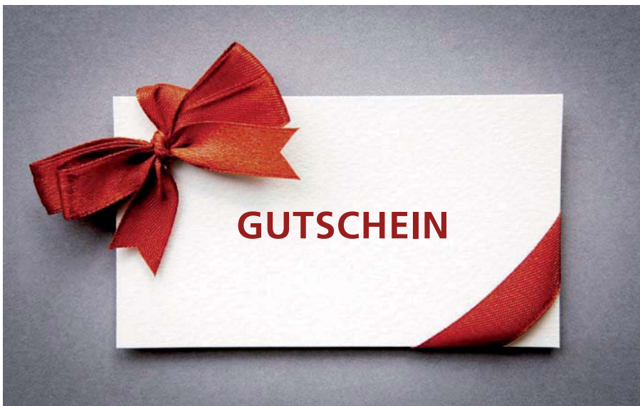
Für Unternehmer gibt es Änderungen beim Gutscheinverkauf